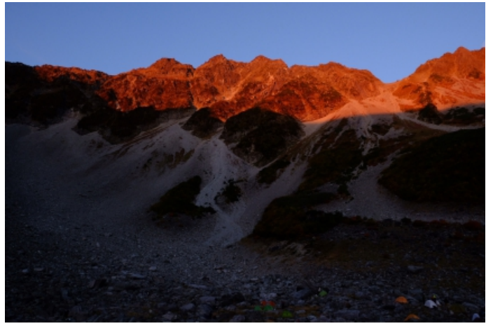
写真6 奥穂高岳のモルゲンロート