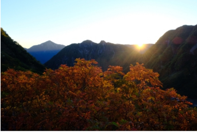
写真1 紅葉と日の出