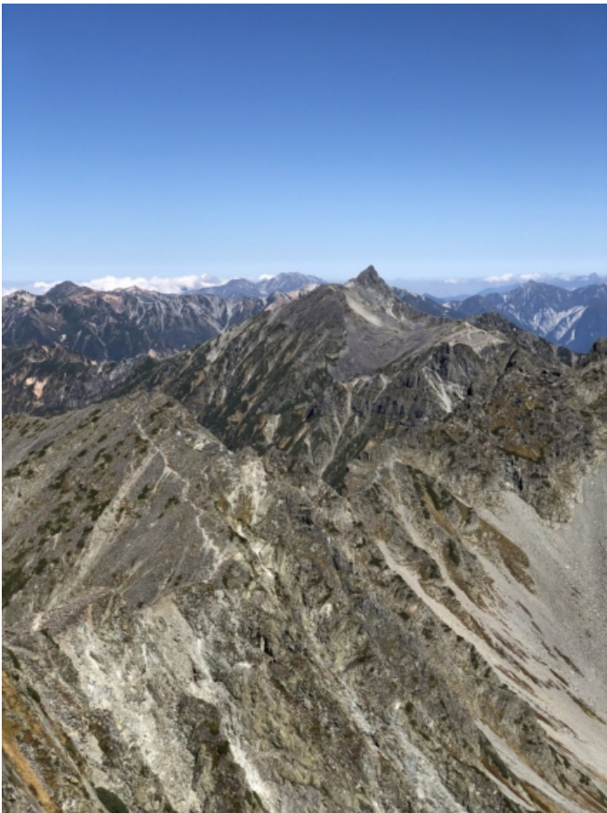
写真3 山頂からの槍ヶ岳 次は鎗だ！（小嶋）